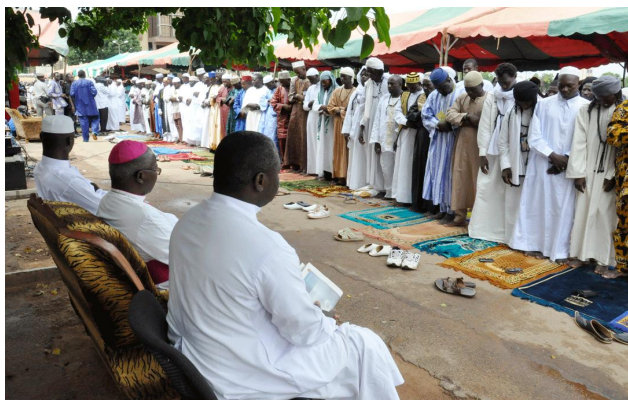
Burkina Faso : préserver l'équilibre religieux

de certains, le rôle de l'État comme instigateur peut poser problème car il peut manquer de crédibilité aux yeux des participants et de leurs fidèles. Pourtant, le dialogue inter-religieux a pour effet la création de réseaux entre les chefs de différentes confessions, qui peuvent offrir un moyen de communication en cas de tensions et donner le ton de relations apaisées à l'intérieur et entre les communautés. Le journal en ligne lefaso.net écrivait : « le Burkina Faso n'est pas un pays à l'abri du fondamentalisme religieux tant que les uns et les autres ne reverront pas leurs discours en rapport avec les convictions de la foi. Actuellement nous arrivons peut-être officiellement à sauver l'essentiel en surpassant les débats ou en évitant d'aborder le sujet mais il faudrait qu'officieusement certaines pratiques de dénigrement et de mauvaises considérations soient contenues pour l'avenir en rapport avec nos convictions religieuses et notre vie en société » xvi . C'est pourquoi, toutes les communautés religieuses sont appelées à réexaminer les aspects fondamentaux de leurs enseignements en vue de promouvoir les relations de paix.