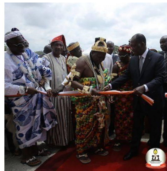
Cérémonie d'installation du Directoire et d'inauguration du Siège de la CNRCT (oct. 2016)

pleine campagne. Cette cérémonie fut ainsi interprétée par certains, notamment l'opposition politique comme un acte de mobilisation des Rois et chefs, considérés comme des grands électeurs, rabatteurs de voix au service du président candidat. Il faut rappeler qu'au second tour de l'élection présidentielle en 2010 opposant le candidat Alassane Ouattara à Laurent Gbagbo Président sortant, « la cour » à la chefferie traditionnelle baoulé fut flagrante. La communauté baoulé, proche du candidat Henri Konan Bédié arrivé en troisième position au premier tour, était considérée comme la clé de la victoire au second tour. Henri Konan Bédié avait appelé à voter Alassane Ouattara. Joignant l'acte à la parole, il avait mobilisé près de 2.500 chefs baoulé à Yamoussoukro pour passer la consigne de vote. Dans le même temps, Laurent Gbagbo sollicitait la Reine de Sakassou, considérée comme la souveraine du Royaume baoulé, pour avoir le « vote baoulé ». L'instrumentalisation de la chefferie à des fins électoralistes semble ainsi une pratique bien enracinée dans la culture des élites politiques en Côte d'Ivoire.